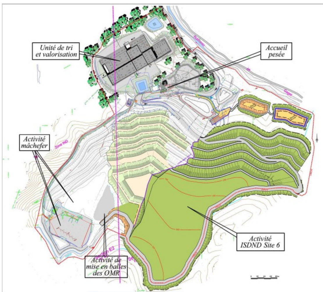
Figure 2 – Emplacement des installations existantes et projetées de l'ISDND de Roumagayrol :

Les aménagements de l'ICPE de Roumagayrol (partie existante et extension prévue) sont représentés sur le plan masse ci-dessous :