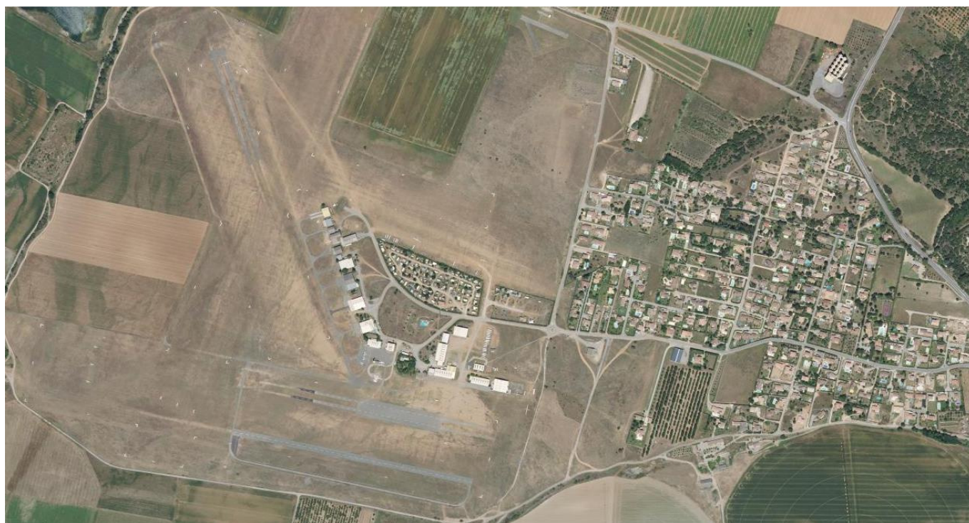
Vue de l'aérodrome de VINON SUR VERDON et la zone d'habitation proche de cette commune.

DU LUNDI 24 JUIN 2019 AU JEUDI 25 JUILLET 2019