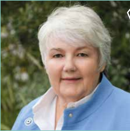
Jacqueline Gourault, ministre de la Cohésion des territoires et des Relations avec les collectivités territoriales

Avec France services, l'État donne accès, partout sur le territoire, à une offre de service public de qualité, garantie par des agents d'accueil qui sont à l'écoute et formés aux différentes démarches administratives. Ce lien humain avec le service public est essentiel et il est complémentaire avec le développement des services en ligne et du numérique partout sur le territoire.