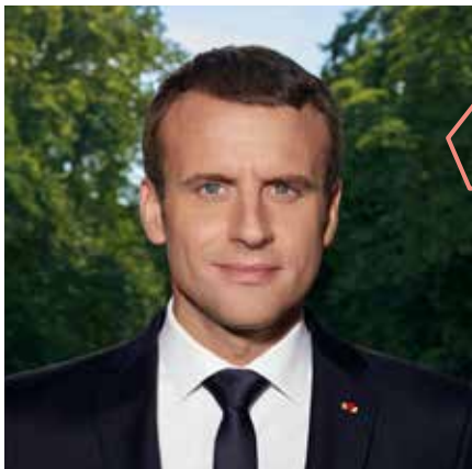
Emmanuel Macron, Président de la République