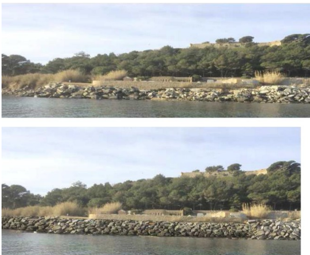
Figure 3: enrochement avant et après travaux

Le cimetière est visible dans son ensemble depuis de nombreux sites publics, le dossier présente comment le projet intègre au mieux la réhabilitation de l'enrochement sans réhausse de la digue existante ni extension de son emprise.