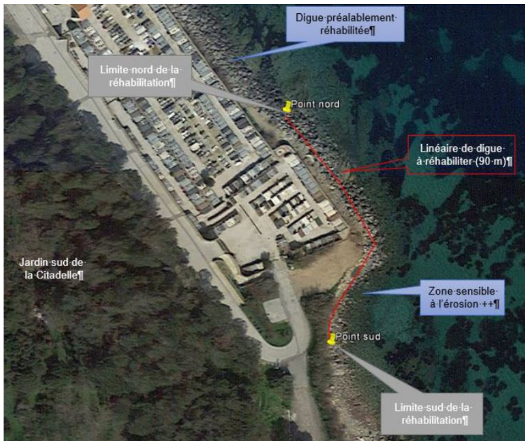
Figure 2: Linéaire concerné par le projet