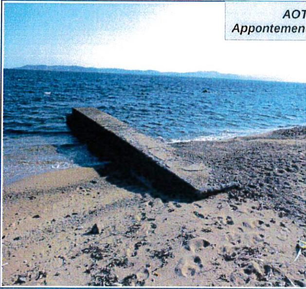
AOT n° 155 Appontement béton de 16 m 2