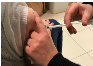
Nb d'injections depuis le 22 novembre dans le Var

➔ Les chiffres de la vaccination dans le Var