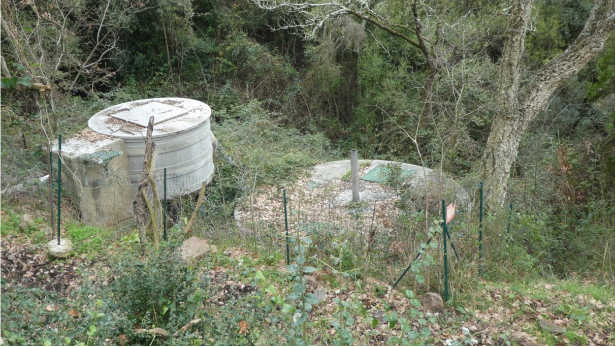
Ci-dessus la STEP du quartier de l'Église (100 EH)