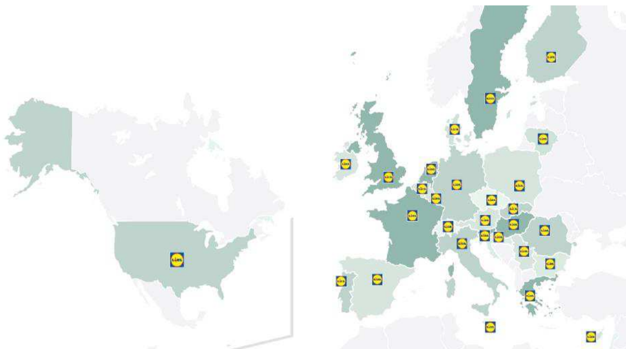
Figure 1 : Implantation de la société LIDL dans le monde

LIDL est le 1 er distributeur alimentaire en Europe et le 4 ème à travers le Monde, présent dans plus de 29 Pays avec ses 200 000 collaborateurs et ses 10 000 magasins.