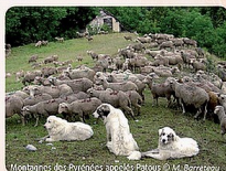
Membres des Pyrénées, espèces Polaris et M. Barrière