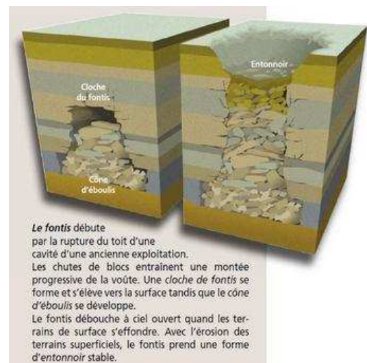
Illustration du phénomène d'effondrement localisé

Les zones d'aléa faible sont inconstructibles en zone urbanisée sauf si les porteurs de projets et leurs bureaux d'études fournissent une attestation selon laquelle la stabilité d'ensemble du bâtiment répond à un niveau d'endommagement ne dépassant pas le niveau N3 (portes coincées et canalisations rompues) tel que défini dans le guide de dispositions constructives pour le bâti neuf situé en zone d'aléa de type fontis , du CSTB du 29 octobre 2012 .