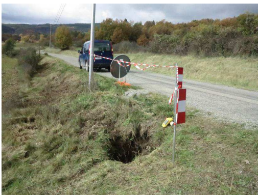
Effondrement localisé, novembre 2015 RD16 commune de Sigonce