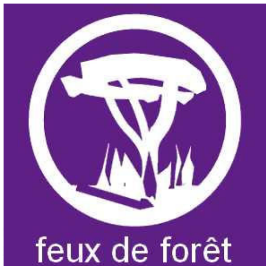
Information sur le risque feux de forêt existant