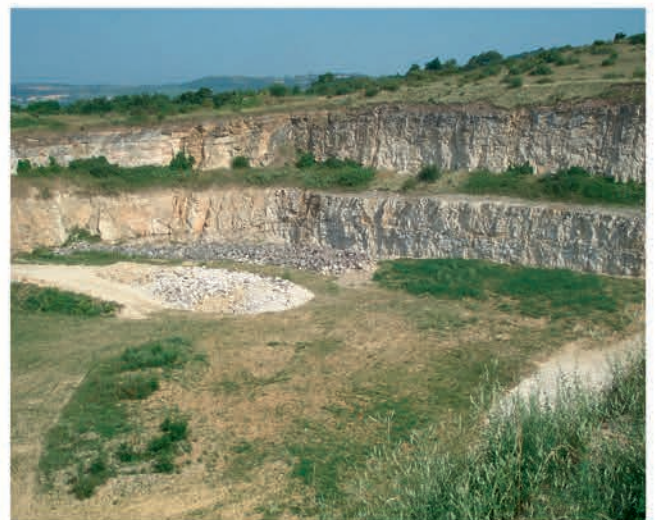
Maintien des fronts de taille réaménagés pour la nidification des espèces rupicoles.

L'efficacité de la séquence ERC est favorisée par sa mise en œuvre planifiée et anticipée dès la conception du projet et pour chacune de ces trois phases.