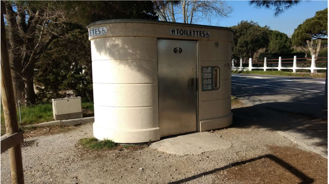
Figure 1 - Sanisette publique payante accessible aux personnes en situation de handicap ou à mobilité réduite