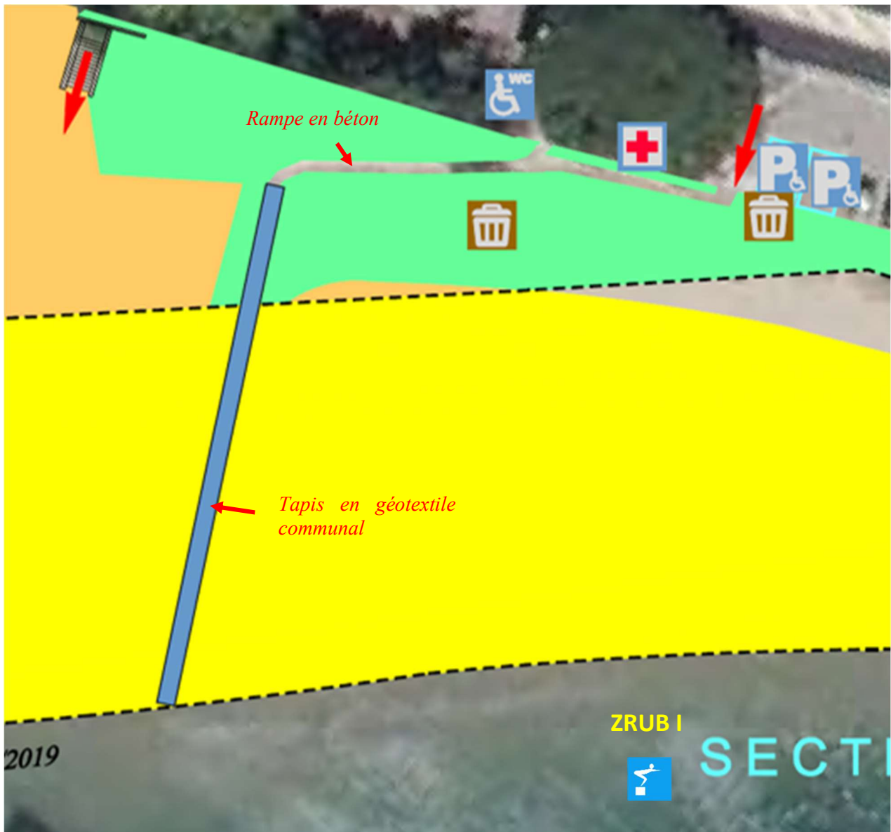
Figure 3 - Extrait du plan de concession projetée, illustrant l'accès au plan d'eau par le tapis en géotextile communal (en bleu)