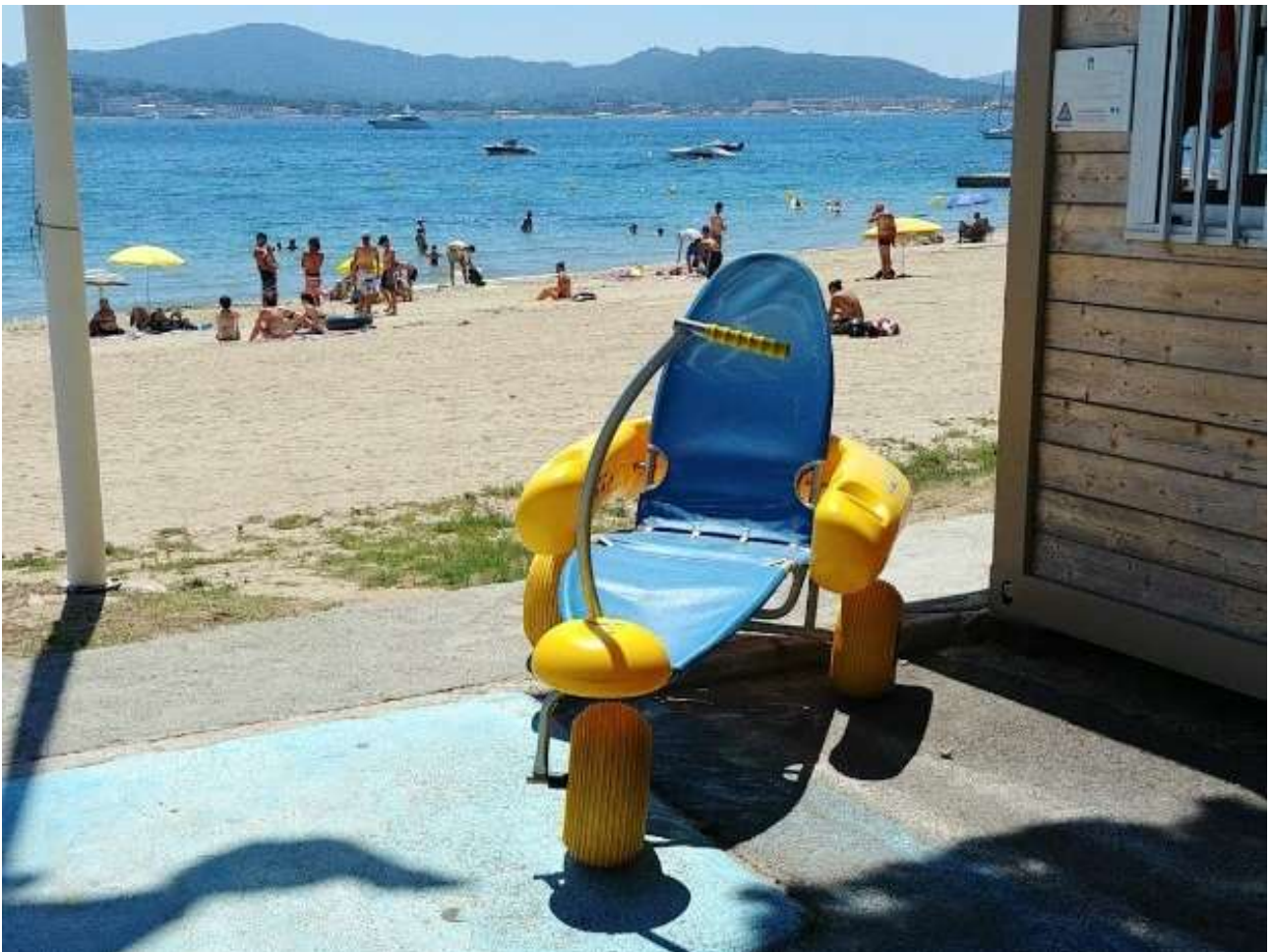
Figure 5 - Fauteuil roulant amphibie du poste de secours du Gros Pin