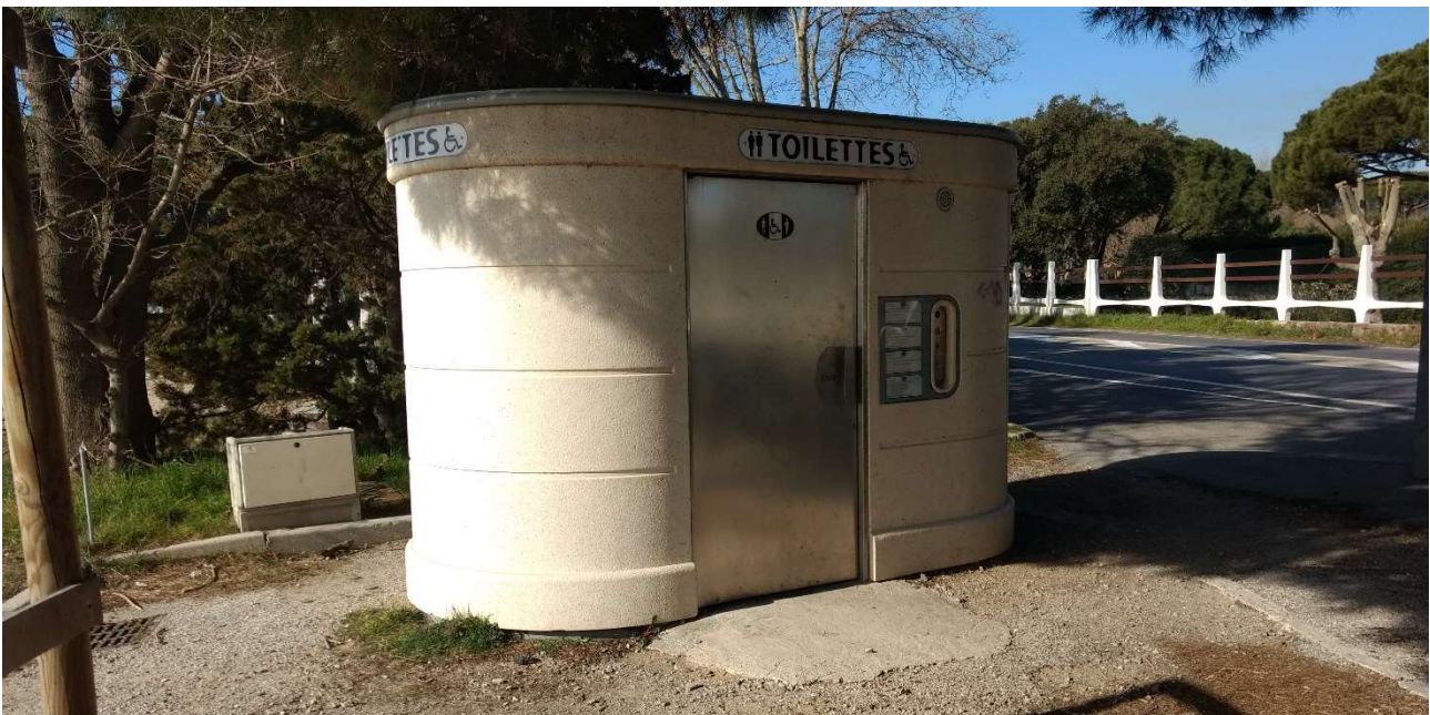
Figure 6 - Sanisette publique payante accessible aux personnes en situation de handicap ou à mobilité réduite

Pour la plage du Gros Pin, la Commune met à disposition du public une sanisette, payante, accessible aux PMR (hors périmètre concédé, à l'ouest du poste de secours).