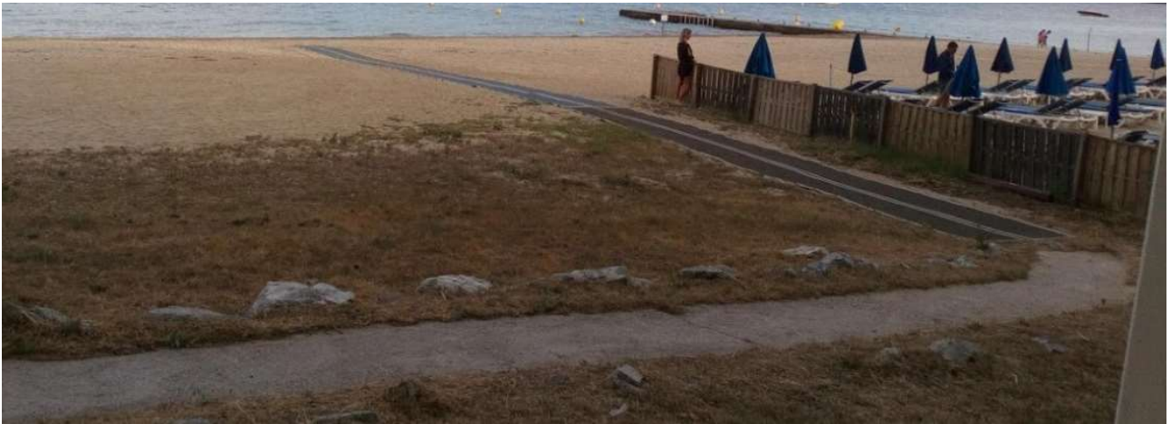
Figure 4 - Photographie illustrant la position du tapis en géotextile installé dans la continuité de la rampe en béton jusqu'au plan d'eau