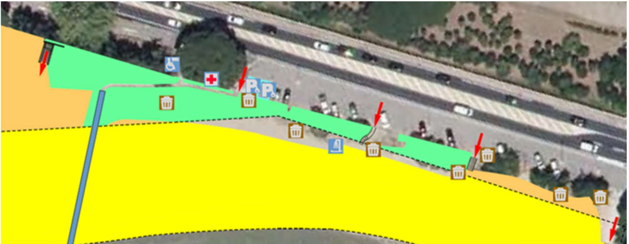
Figure 2 - Extrait du plan de concession projetée, illustrant l'accès à la plage (secteur 1)

concédié par un tapis en géotextile, installé par la Commune pour la saison balnéaire du 15 juin au 15 septembre. De plus, le poste de secours dispose d'un fauteuil flottant amphibie.