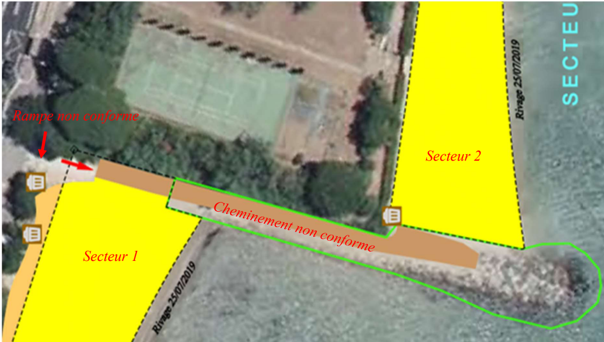
Figure 7 - Extrait du plan de concession projetée, illustrant l'accès à la plage (secteur 2)

Le cheminement sur l'épi pour l'accès au secteur 2 (partie est) de la plage du Gros Pin n'est pas conforme aux normes d'accessibilité PMR. De plus, la rampe d'accès pour véhicules précédent ce cheminement piéton offre une pente trop importante. Cependant, sous réserve de bénéficier de l'assistance d'une tierce personne, une personne à mobilité réduite peut emprunter ce trajet pour atteindre la partie est de la plage.