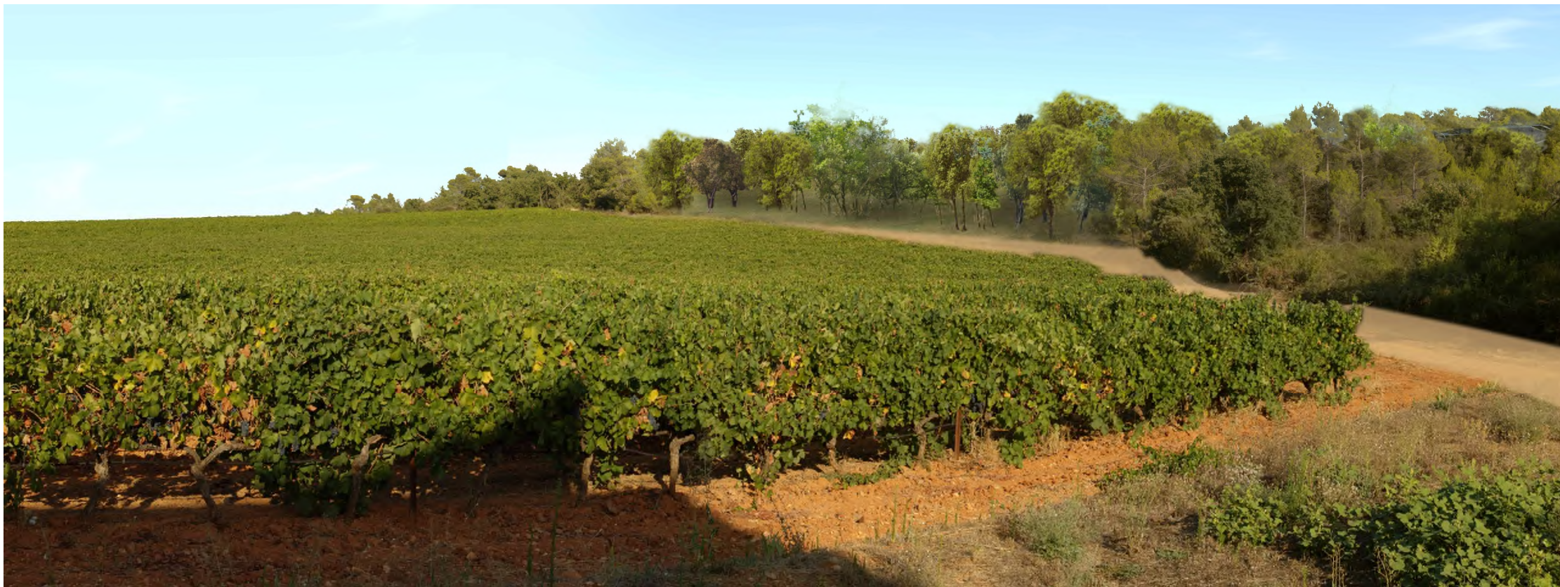
PHOTOMONTAGE –PARTIE NORD DU PROJET