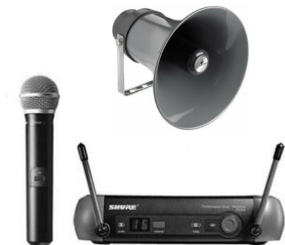
Dispositif de sonorisation