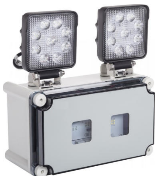
Éclairage de sécurité