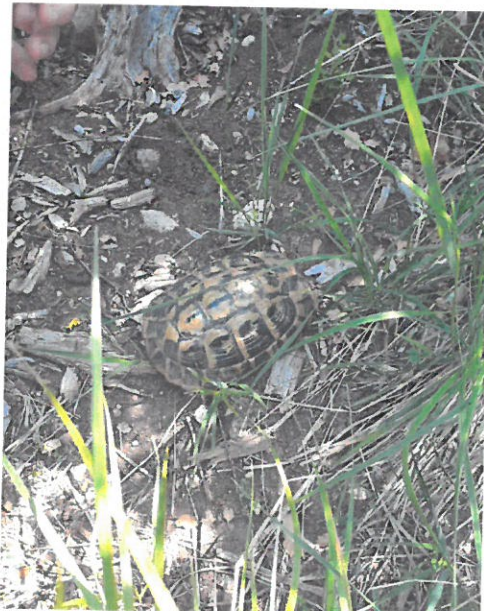
Photo n° 2 : tortue d'Hermann femelle adulte âgée d'environ 30 ans (Source : DDTM du Var/SAF, 19/05/2022)