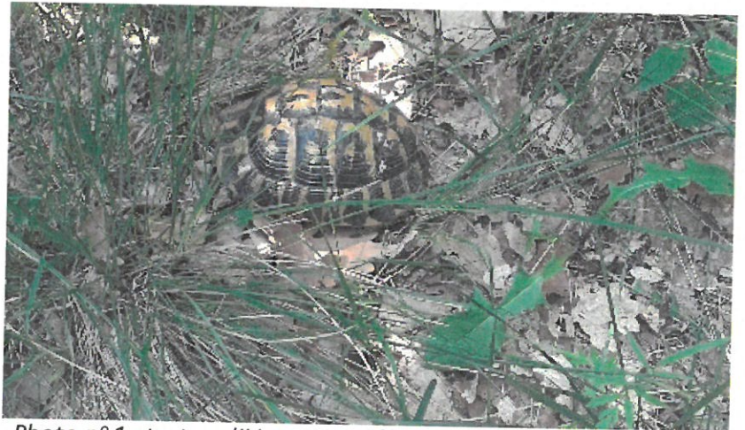
Photo n° 1 : tortue d'Hermann mâle adulte âgée d'environ 20 ans