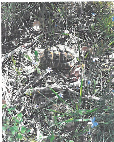
Photo n° 3 : tortue d'Hermann mâle adulte âgée d'environ 20 ans