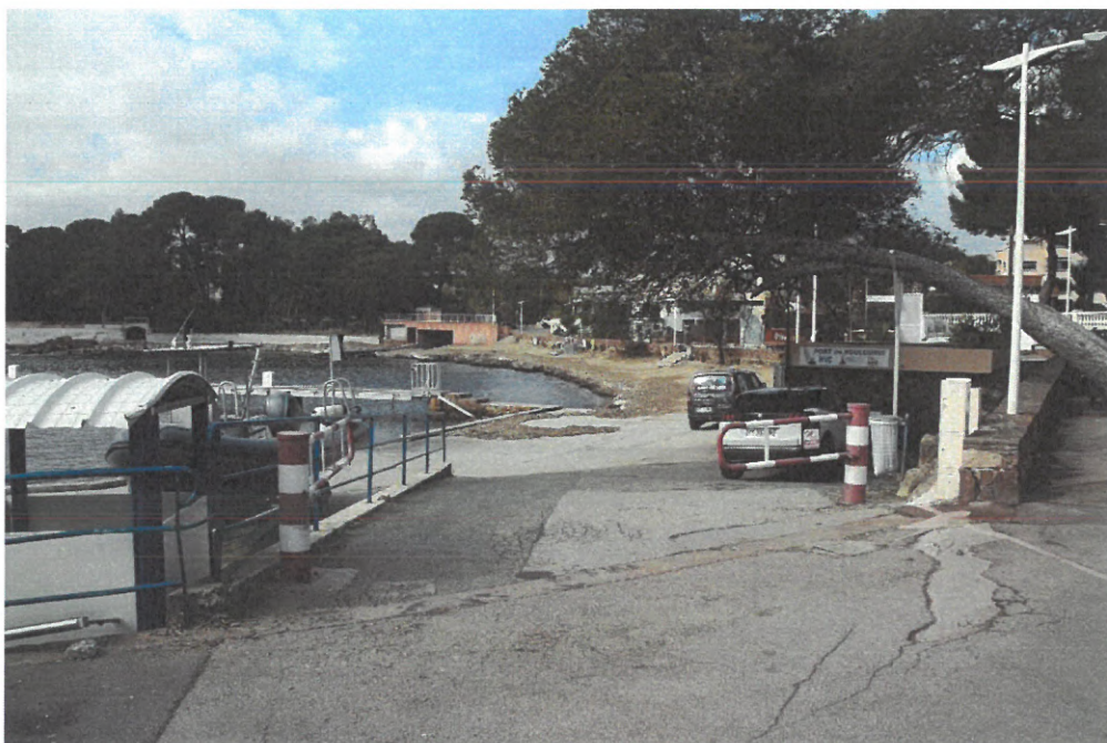
Accès à la plage et au lot n°2 depuis le quai du port de Boulouris

Les personnes à mobilité réduite pourront accéder au lot n°2 (terrasse du club de plongée) par le port de Boulouris doté de deux places de parking qui leur sont dédiées (cf plan d'aménagement).