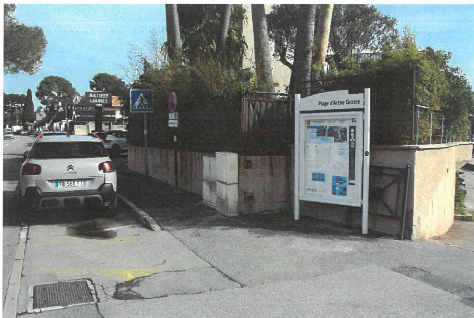
Stationnement PMR (RD 559) et voie de desserte de la plage

Des places de parking pour PMR sont matérialisées le long de la route départementale.