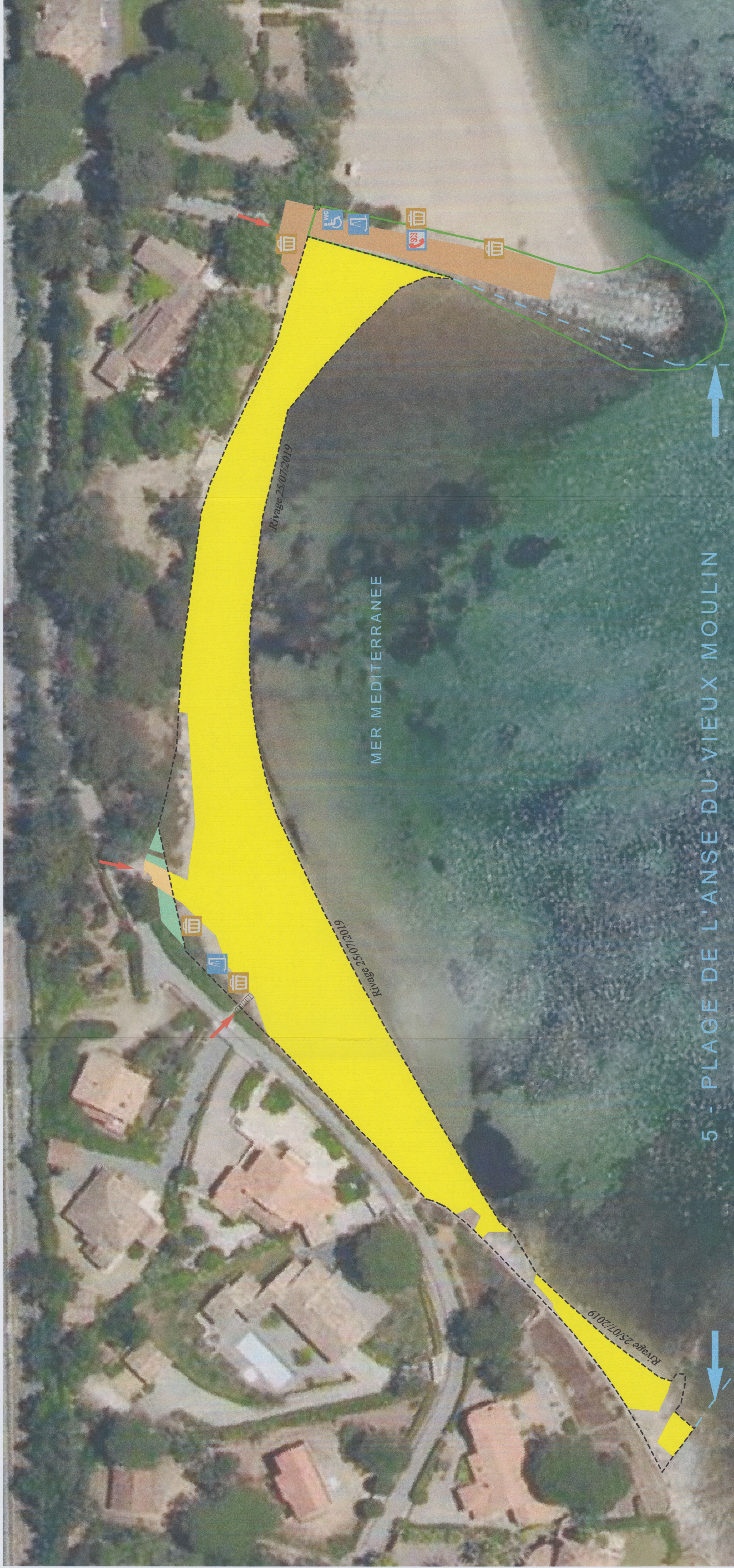
5 - PLAGE DE L'ANSE DU VIEUX MOULIN