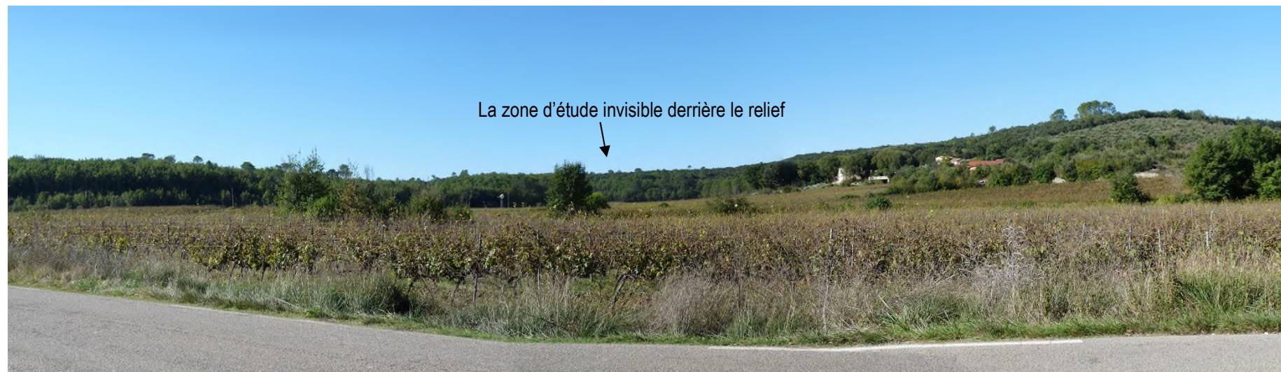
6/ Depuis la RD34, à proximité du lieu-dit Favori