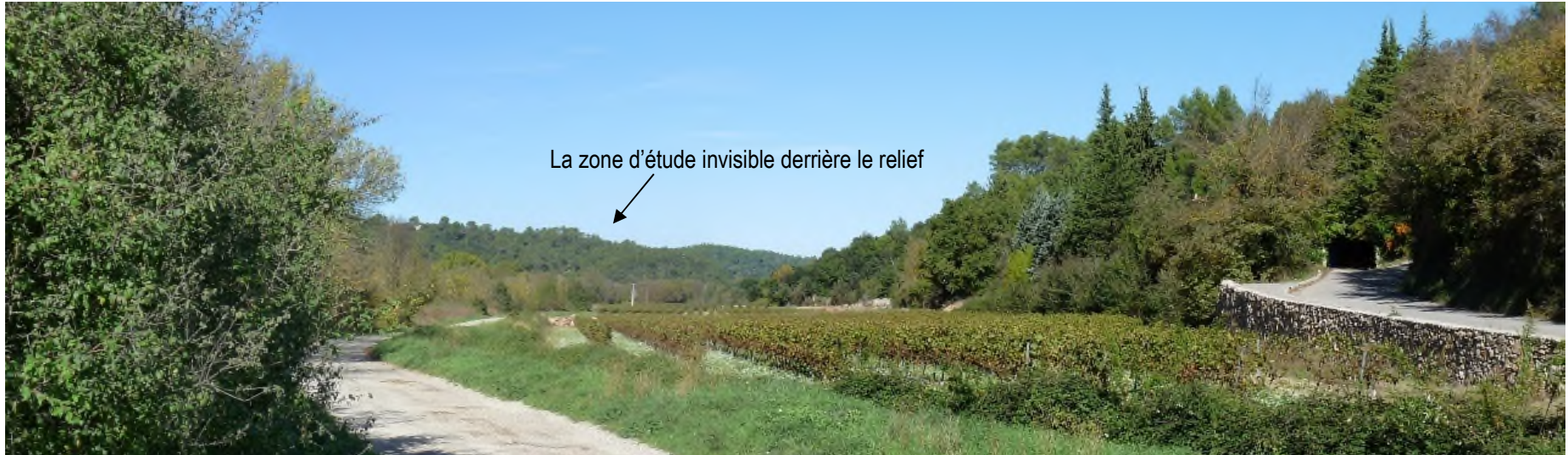
4/ Depuis la partie nord du village de Bras (Lotissement les Templiers)