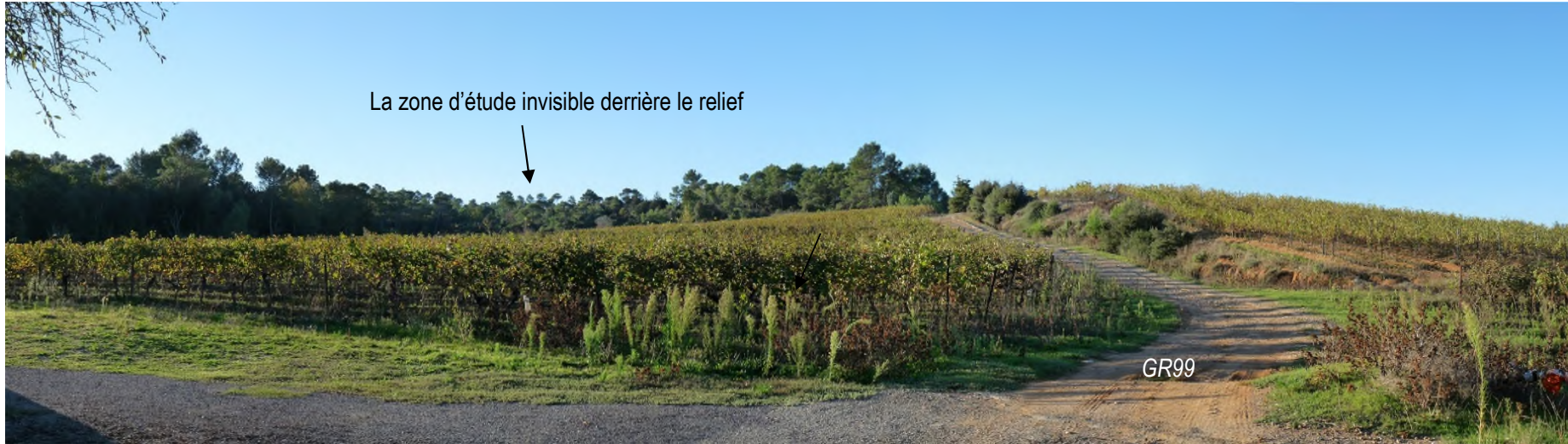
3/ Depuis la chapelle Notre Dame