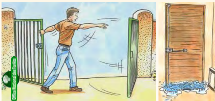
Ouvrir le portail pour faciliter l'accès des pompiers Fermer les bouteilles de gaz situées à l'extérieur Se calfeutrer à l'intérieur

ne surtout pas fuir, elle est votre meilleure protection.